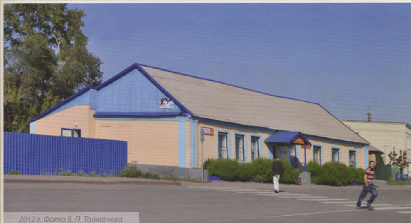
2012 г.

Ул. Ленина, д. № 103. В последнее десятилетие старое бревенчатое здание, облицованное современными материалами, обрело иной вид и иное содержание: в доме разместился магазин «Валенсия». Вид со стороны стоянки такси.